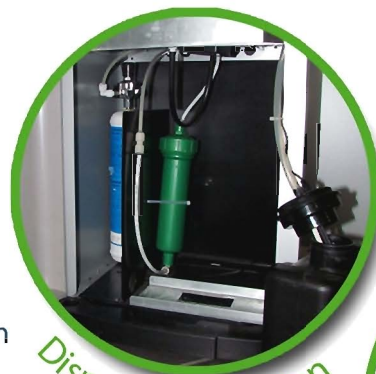
Dispositif de filtration